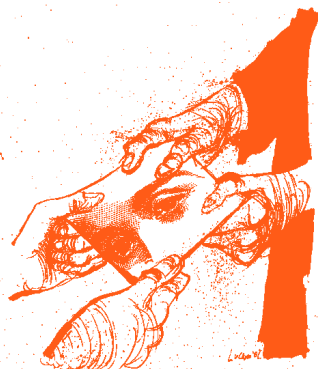
ILUSTRACIÓN: MIRIAMNO LUCIANO

Para mayor información: www.abuelas.org.ar